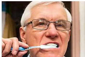
Un estudio establece una conexión entre no lavarse los dientes y las enfermedades cardiovasculares