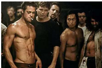
Científicos españoles prueban que el cerebro de mujeres y hombres no responde igual ante las películas violentas