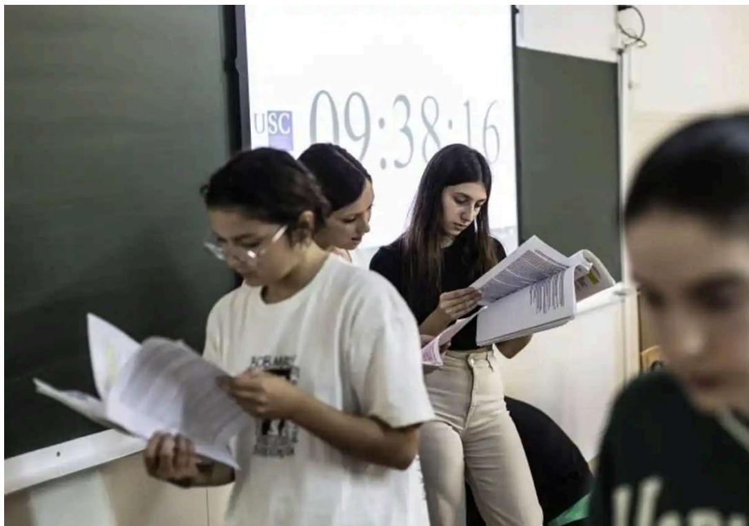
Pruebas de Selectividad en Santiago en 2023 // MUÑIZ

El gobierno gallego inicia los trámites para tener a tiempo el compromiso de Rueda para el 18F