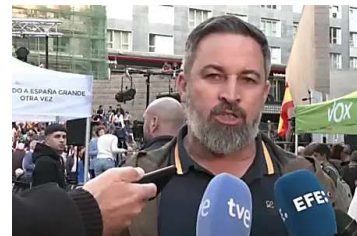
Abascal: "No me gritan "Gora Euskadi!", me gritan "Viva Mohamed VI", y ése es el problema