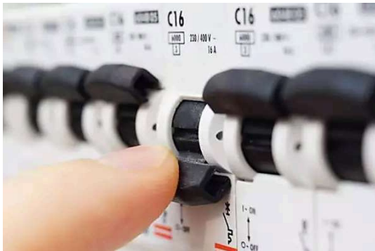
¿Cuáles son las compañías eléctricas más baratas? Ahorra en tu factura: El consejo que las eléctricas no quieren que sepas ofertas-luz-y-gas.tarifas-energia.io | Patrocinado