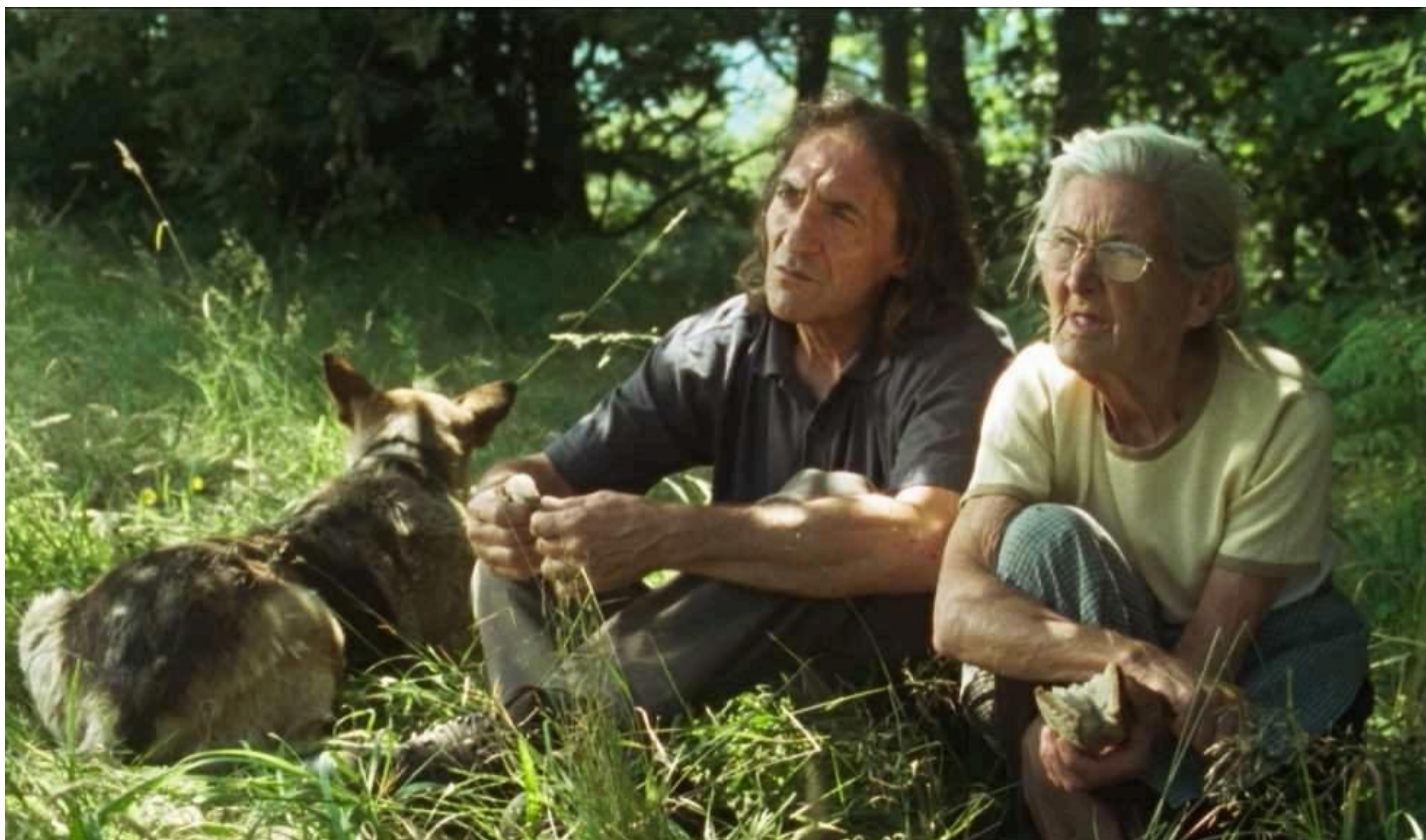
photo_camera Fotograma do filme 'O que arde'.

A cidade suíza de Delémont acolle desde esta cuarta feira o festival Autres Horizons, no cal se proxectarán oito filmes galegos