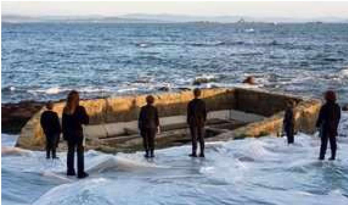
photo_camera Un fotograma de 'Lavadoiro', de Ana Amado e Lois Patiño.

O festival internacional de cinema con sede en Tui, celebrará unha longa traxectoria que se destaca por presentar primeiras retrospectivas dedicadas a aclamados cineastas e directores de culto.