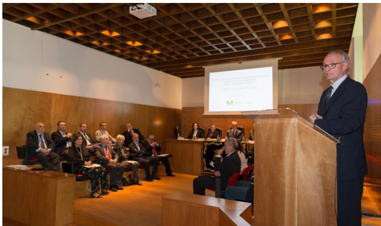
Discurso de Antón Costas no seu ingreso na Real Academia Galega de Ciencias