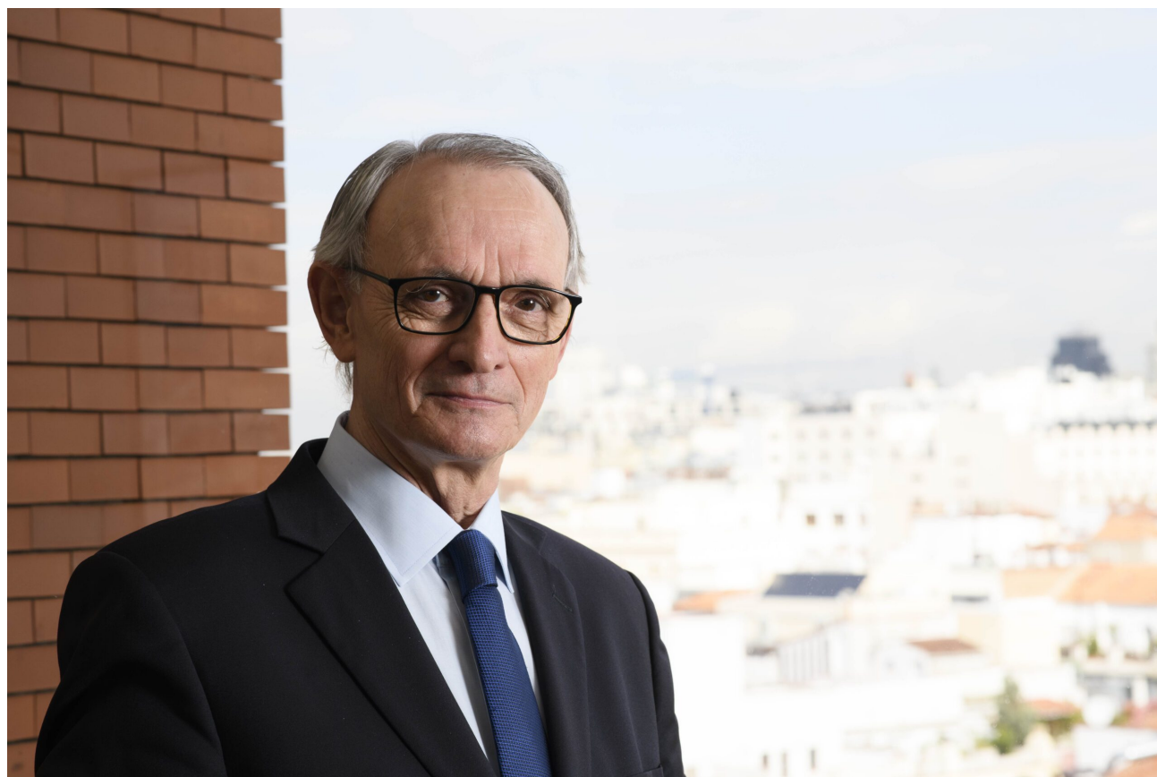
Antón Costas © CES

O economista pechou a súa intervención amosando o seu optimismo e sinalando que "en contra do que se pensa, estes tempos de frustración, resentimento e incerteza favorecen a construción dun novo contrato social".