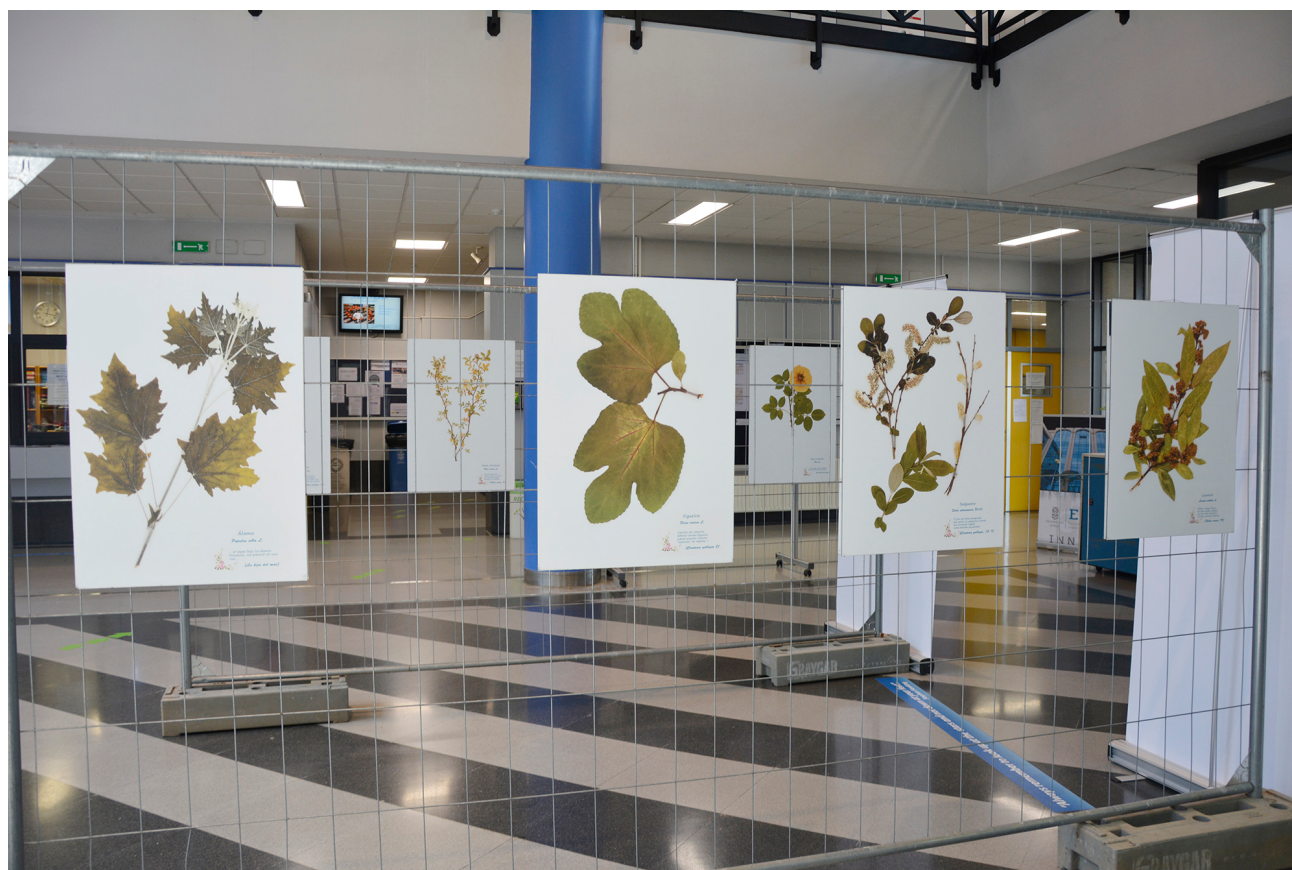
Exposición 'O herbario de Rosalía', no edificio Politécnico do campus de Ourense

A exposición, coas fotografías de Miguel Fraga, chegou o 1 de abril á Universidade de Vigo, onde se poderá ver nos seus tres campus. No edificio Politécnico do campus ourensán estará ata o 12 de abril; do 16 ao 26 de abril pasará pola Escola de Enxeñaría Forestal de Pontevedra; e do 30 de abril ao 10 de maio estará no edificio Redeiras do campus de Vigo.