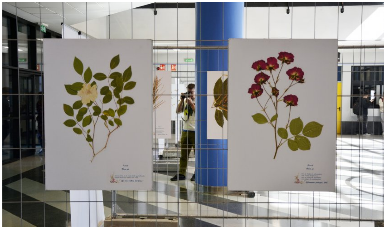
Exposición 'O herbario de Rosalía', no edificio Politécnico do campus de Ourense