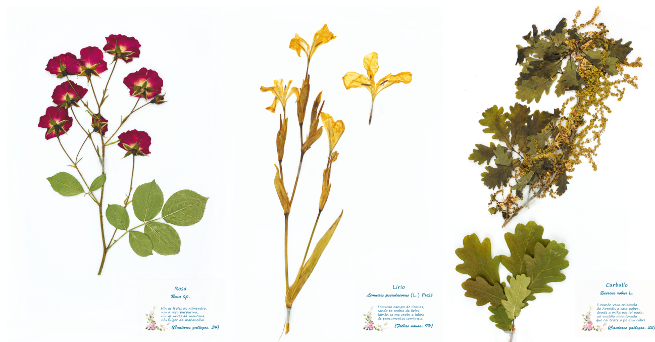
Rosa, lirio e carballo, no 'Herbario de Rosalía'