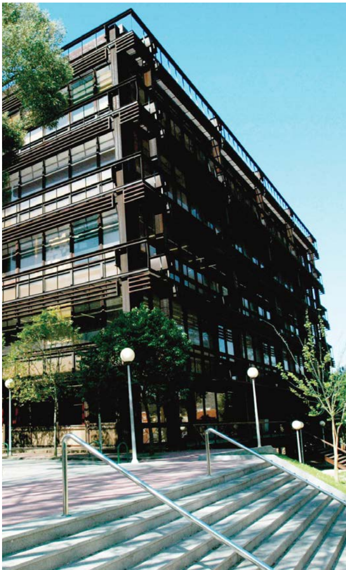
Edificio de Ferro Facultade de Ciencias da Educación Rúa Doctor Temes s/n, Ourense Tel. +34 988 387 101

Máis información: http://ceadp.webs.uvigo.es/