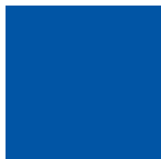
Pantone Reflex Blue