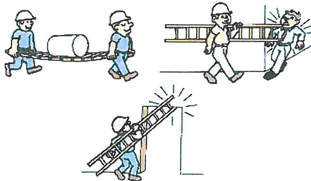
Formas incorrectas de transportar escadas