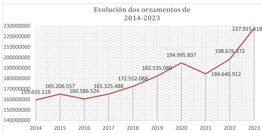
Gráfico 1. Evolución dos orzamentos da UVigo 2013-2023

Esta contía supón un incremento do +14,75% en relación co exercicio de 2022. Este incremento xustifícase na subida derivada da sinatura do novo plan de financiamento do SUG (PFSUG) e no incremento na captación de fondos por mor das novas convocatorias para a investigación e do fondo do Plan de recuperación, transformación e resiliencia.